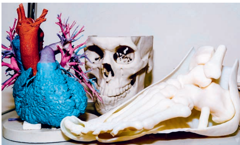
Die Möglichkeiten für den 3D-Druck im medizinischen Bereich sind vielfältig.

es sich um das Herz eines wenige Wochen alten Säuglings mit einem schweren Herzfehler.» Dank dem Modell in Originalgrösse konnten sich die Eltern im wahren Sinne des Wortes ein Bild des kranken Herzens und der geplanten Operation machen, was für alle Beteiligten in dieser Situation eine grosse Hilfe darstellte.