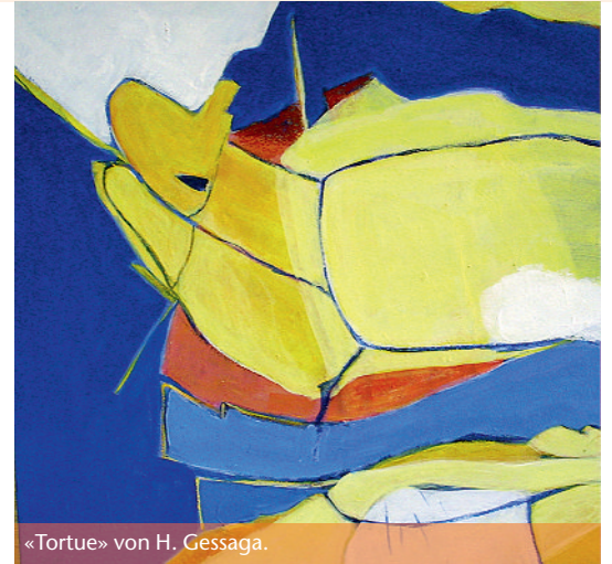
«Tortue» von H. Gessaga.

Dass in vielen Gebieten Millionen von noch scharfen Minen liegen, macht das Leben dort zu einer Art psychischer Folter, da man nie weiss, wann man auf