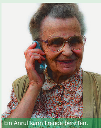
Ein Anruf kann Freude bereiten.