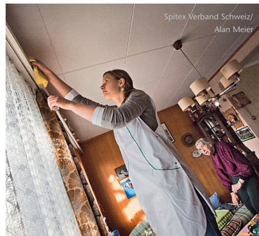
Les prestations d'économie ménagère et de prise en charge sociale représentent presque 40% des heures facturées par l'Aide et soins à domicile.