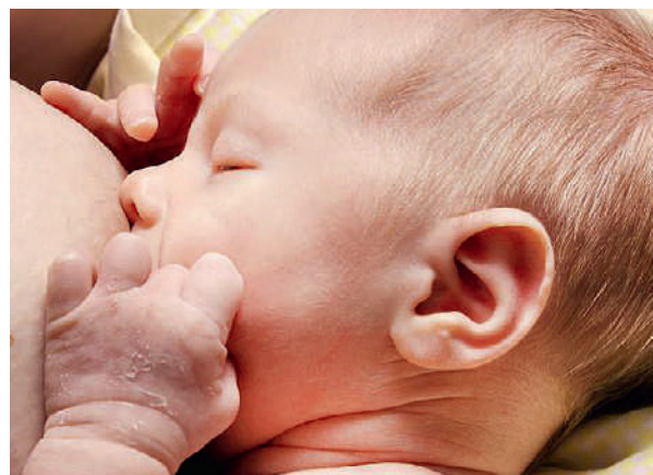
L'allaitement maternel présente des avantages essentiels pour la santé de la mère et de l'enfant.