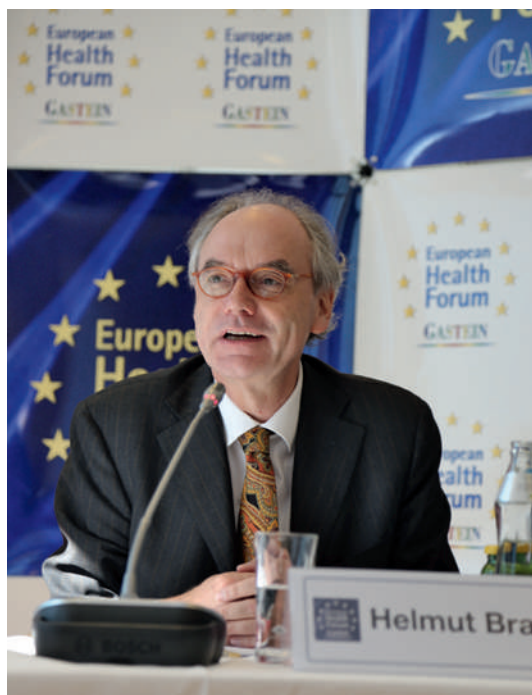
Helmut Brand, Präsident des European Health Forums: «Wir müssen uns fragen, wann der kritische Punkt erreicht ist, an dem Sparprogramme ein Risiko für die Gesundheitsversorgung darstellen.»

«Gesundheitssysteme müssten sich an die veränderten ökonomischen Bedingungen anpassen.»