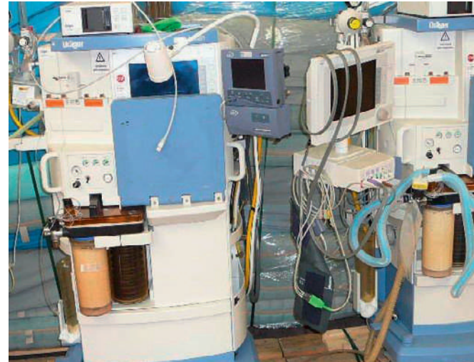
Die in der Schweiz ausrangierten Apparate werden anderswo noch gute Dienste leisten.

bedarf von Schweizer Spitalern sorgen technische Fortschritte, demographische Veränderungen, Deregulierung, verschärfter Wettbewerb und steigende Ansprüche. Die Lebenszyklen von Produkten und Dienstleistungen nehmen ab, das Segment der Privatpatienten nimmt zu und damit die Spezialisierung kleinerer und mittlerer Kliniken auf Nischenangebote. Spitalschliessungen werden durch den Ausbau der Zentren kompensiert. Da alle Prognosen mit einem weiteren Zuwachs des Gesundheitsmarktes rechnen, wird weiter investiert und erneuert.