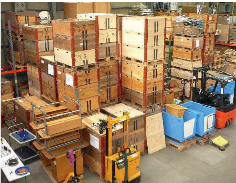
Die Warenströme aus dem Gesundheitswesen nehmen zu.