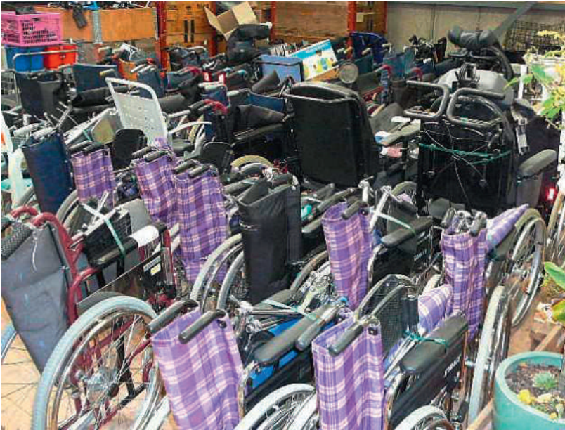
Viele Freiwillige helfen beim Verpacken der Materialien.