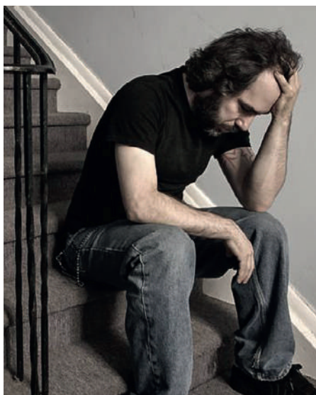
Depression: Mangel an Noradrenalin oder Serotonin? Eine wichtige Frage für die Therapie.