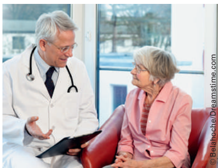
Nicht nur die Kommunikation mit Patienten will gelernt sein, auch die mit Kollegen.