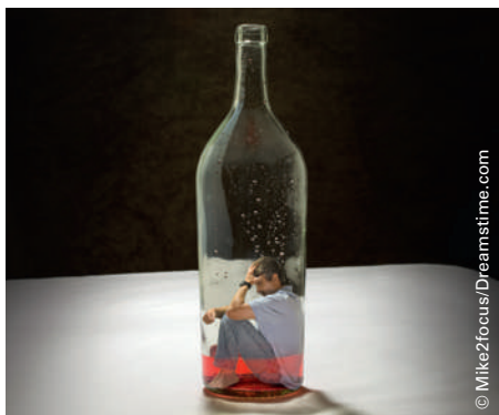
Bei der Ausbildung im Bereich Suchtmedizin sollten Hausärzte stärker einbezogen werden.