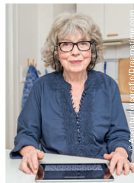
Le nombre de seniors qui utilisent internet a augmenté.

Pro Senectute a chargé l'Institut de gérontologie de l'Université de Zurich de mener une étude sur l'utilisation d'internet et des appareils portables chez les personnes de 65 ans et plus. L'étude montre que le nombre de seniors qui utilisent internet a augmenté de moitié depuis 2010 et qu'un tiers d'entre eux possèdent une tablette ou un smartphone. Les personnes âgées qui utilisent internet se sentent socialement mieux intégrées et pensent qu'internet les aidera à rester plus longtemps indépendantes. Par contre, celles qui ne s'intéressent pas aux nouvelles technologies sont toujours davantage coupées des informations et des services.