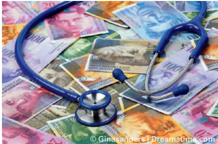
Das Ungleichgewicht der Prämienzahlungen zwischen einzelnen Kantonen wird ausgeglichen.

Zwischen 1996 und 2013 haben die Versicherungen einiger Kantone im Vergleich zu den Leistungen zu hohe, in anderen Kantonen zu tiefe