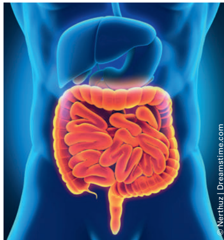
Les résultats des chercheurs mettent en évidence le rôle du microbiote fongique dans le développement ou la sévérité des MICI.

(Assistance Publique – Hôpitaux de Paris)