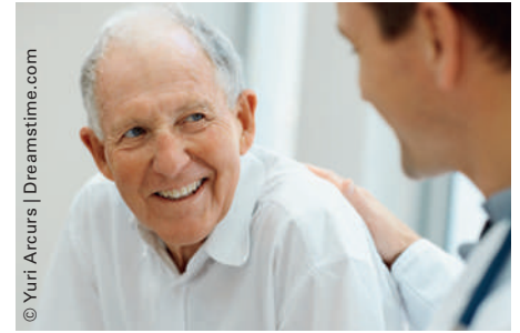
Bei chronischen Schmerzerkrankungen oder Demenz kann Lachen Wunder wirken.