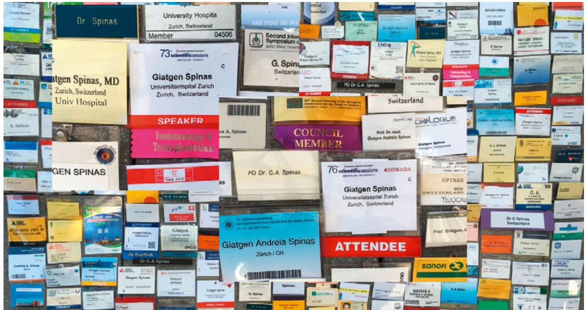
Erinnerungen an eine lange akademische Laufbahn.

wie Diabetes kann sich diese Beziehung phasenweise auch schwierig gestalten. Aber nichtsdestotrotz muss doch das oberste Ziel von uns Ärztinnen und Ärzten das Wohl der uns anvertrauten Patienten sein. Die conditio humana ist das Kerngeschäft unserer Profession, auch wenn man medizinische Forschung betreibt. Denn das Auseinanderklaffen von care und cure wirkt sich bei chronischen Krankheiten wie dem Diabetes katastrophal aus.