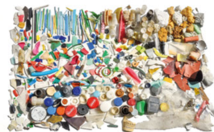
Tous les plastiques trouvés sur la plage Maladaire du lac Léman en mars 2016.