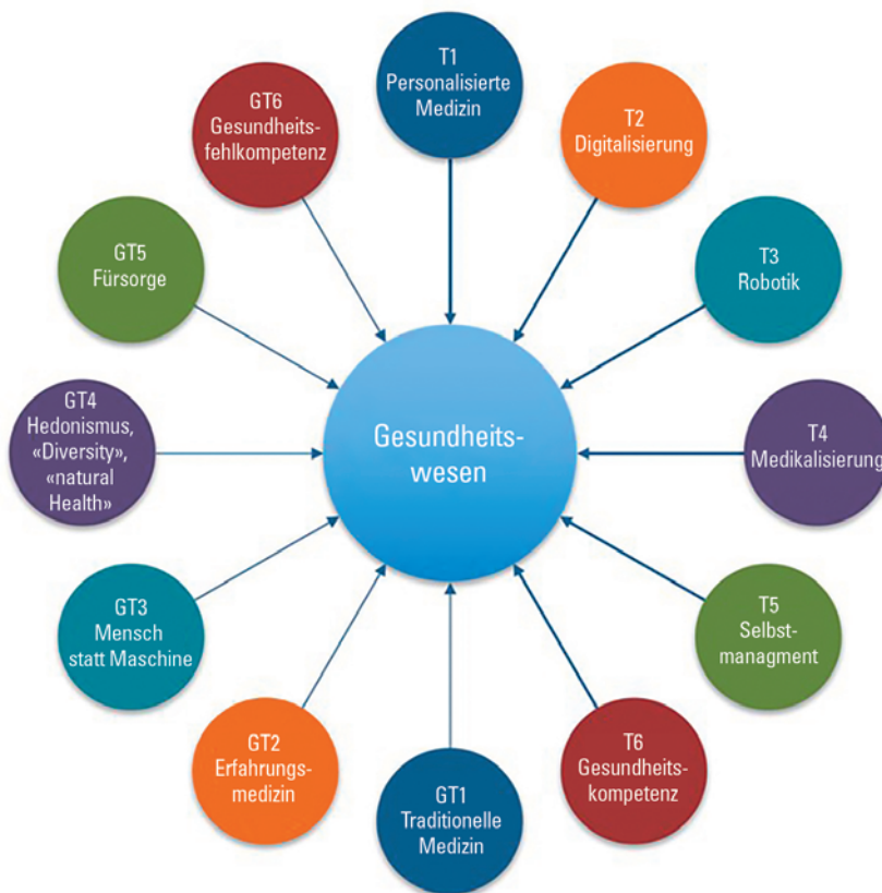
Abbildung 2: Trends und Gegentrends.

Das gesundheitliche Selbstmanagement wird künftig vermehrt auch die Gesundheitsförderung und die Prävention miteinbeziehen. Entsprechende internetgestützte Dienstleistungen (mobile Health) sind bereits in grosser Menge vorhanden [6]. Es ist absehbar, dass die entsprechenden Geräte und Überwachungstechniken in den kommenden Jahrzehnten stark verbessert und die Zahl der Gesunden, die so ihren Zustand kontinuierlich überwachen, deutlich zunehmen werden.