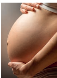
Par l'analyse des sécrétions vaginales, la serviette peut confirmer ou non une suspicion de rupture de la poche des eaux.

Des chercheurs du CHUV et de l'EPFL ont développé une serviette hygiénique «intelligente» qui permet de surveiller les risques d'accouchement prématuré. Cela évite ainsi l'hospitalisation – souvent de longue durée – des femmes concernées, jusqu'ici la seule solution lors de suspicion de tel accouchement. Environ 10% des femmes accouchent prématurément. Grâce à un microsystème in-