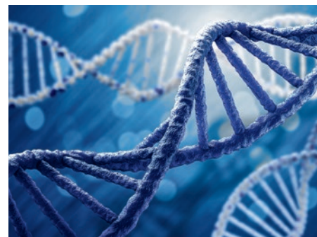
© Sergey Khakimullin | Dreamstime.com, Symbolbild