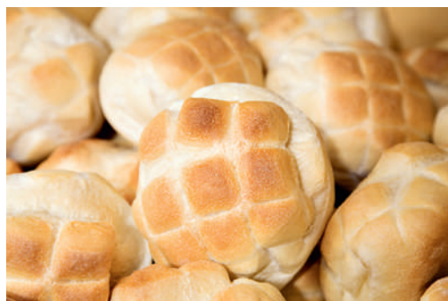
Glutenbestandteile führen bei Menschen mit Zöliakie zu einer entzündlichen Erkrankung der Darmschleimhaut mit weitreichenden gesundheitlichen Folgen.

Die Europäische Kommission plant, die Verordnung 41/2009 aufzuheben, die bislang auch die Kennzeichnung glutenfreier Lebensmittel regelt. Für Zöliakiebetreffende wäre dies problematisch, denn sie sind auf glutenfreie Lebensmittel angewiesen. Seit dem 1.1.2012 gibt es bezüglich der Zusammensetzung und Kennzeichnung glutenfreier Lebensmittel Rechtssicherheit in Europa. Die aktuelle Diskussion stelle diese aber wieder infrage, sagt der deutsche Diätverband. Im Rahmen der neuen Verordnung wäre die Möglichkeit nicht mehr gegeben, zweckdienliche Hinweise für Verbraucher und Fachkreise zu machen. Konkret bedeutet dies, dass weder Menschen mit Zöliakie noch Ernährungsfachkräfte oder Mediziner über die Bedeutung glutenfreier Lebensmittel als bislang einzige Therapie bei Zöliakie informiert werden dürften.