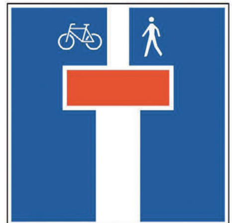
Nicht immer eine Sackgasse: Manchmal sind vermeintlich unpassierbare Wege auch für Fussgänger und Fahrradfahrer durchlässig.