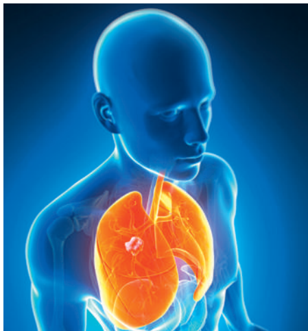
Le cancer des poumons est le plus mortel depuis plus de 40 ans.