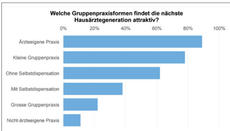
Abbildung 2: Welche Gruppenpraxisformen findet die nächste Hausärztergeneration attraktiv?

Die meisten Antworten auf die Frage nach den drei wichtigsten Faktoren bei der Wahl der zukünftigen Hausarztpraxis konnten sieben Bereichen zugeordnet werden (Tab. 1). Fast drei Viertel aller Jungärzte gaben das Arbeitsklima als einen der drei Faktoren an. Als weitere wichtige Faktoren wurden in absteigender Häufigkeit der Standort, das Arbeitspensum, die Infra-