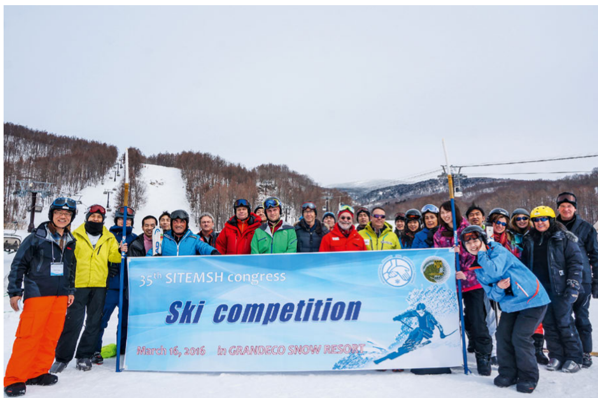
Abbildung 2: Die «Coupe du président» 2016 in Inawashiro, Japan.

Und die SITEMSH wurde immer internationaler, aber auch immer kleiner. Neben den erwähnten Gründerländern stiessen Andorra (1990), Spanien (1993), Chile (2007), Griechenland (2008), Argentinien, die USA, Schottland, Tschechien und Ungarn dazu. Ganz neu sind nationale Sekretäre aus Japan, Iran, Kasachstan und China. Heute zählt die SITEMSH 18 Mitgliederlän-