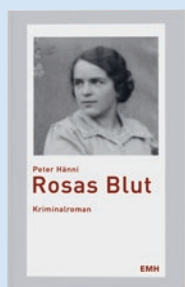
Rosas Blut von Peter Hänni