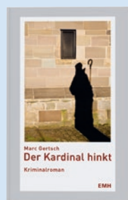
Der Kardinal hinkt von Marc Gertsch