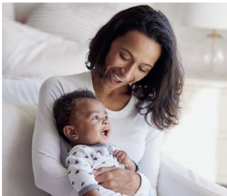
Oxytocin stärkt die Mutter-Kind-Beziehung und steuert soziale Bindungen, ist aber auch an diversen psychischen Störungen beteiligt. (Symbolbild, © Monkey Business Images | Dreamstime.com)

Erstmals ist es gelungen, einen detaillierten dreidimensionalen Bauplan des Oxytocin-Rezeptors zu bestimmen, an den das Hormon bindet. Ausserdem machten Forscher der Universität Zürich noch eine weitere Entdeckung: Damit das von Oxytocin ausgelöste Signal effizient übermittelt werden kann, muss der Oxytocin-Rezeptor mit Cholesterin und Magnesium interagieren. Das Zusammenspiel des Rezeptors mit diesen beiden Substanzen war bisher unbekannt. Diese neuen Erkenntnisse helfen, neue Medikamente zur Behandlung einer Reihe von Krankheiten zu entwickeln. Oxytocin ist an verschiedenen Störungen der psychischen Gesundheit wie Autismus, Asperger-Syndrom, soziale Ängste oder Sucht anfälligkeit, aber auch an der Fortpflanzung beteiligt.