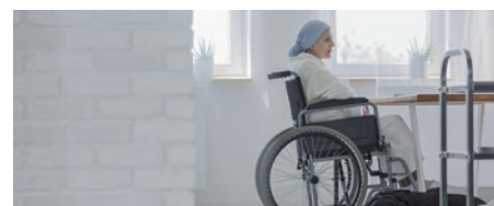
50% des patients interrogés n'auraient pas été assez informés des effets indésirables à moyen terme (© Katarzyna Bialasiewicz | Dreamstime.com, image symbolique).

Oft werden die Todesursachen von COVID-19 mit jenen einer saisonalen Influenzainfektion verglichen. Nun zeigen aber Autopsieberichte von Opfern der Spanischen Grippe (1918/19) und Covid-19-Autopsien einen frappanten Unterschied: In keinem einzigen der Berichte zur Spanischen Grippe werden sichtbare Blutgerinnsel erwähnt. Dagegen werden in 36% der 75 bisher publizierten COVID-19-Autopsien eine Lungenarterien-Thrombose bzw. eine Lungenembolie festgehalten. Und dies, obwohl die Betroffenen eine für Hospitalisierte normale Thrombose-Prophylaxe erhielten. Auch lebensbedrohliche Lungenentzündungen und kapillare Mikrothromben sind deutlich häufiger als bei Personen mit einer «normalen» Grippe. Dies zeigt eine Studie von Pathologinnen und Pathologen des Universitätsspitals Zürich. Unter der Leitung von Prof. Nils Kucher, Direktor der Klinik für Angiologie, wird deshalb die Sicherheit und Wirksamkeit eines Blutverdünners für COVID-19-Patienten untersucht. Die sogenannte OVID-Studie sucht weiterhin Teilnehmer. Interessierte ab 50 Jahren mit positivem COVID-19-Testresultat können sich unter 043 253 03 03 melden. (usz.ch)