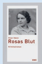
Rosas Blut von Peter Hänni