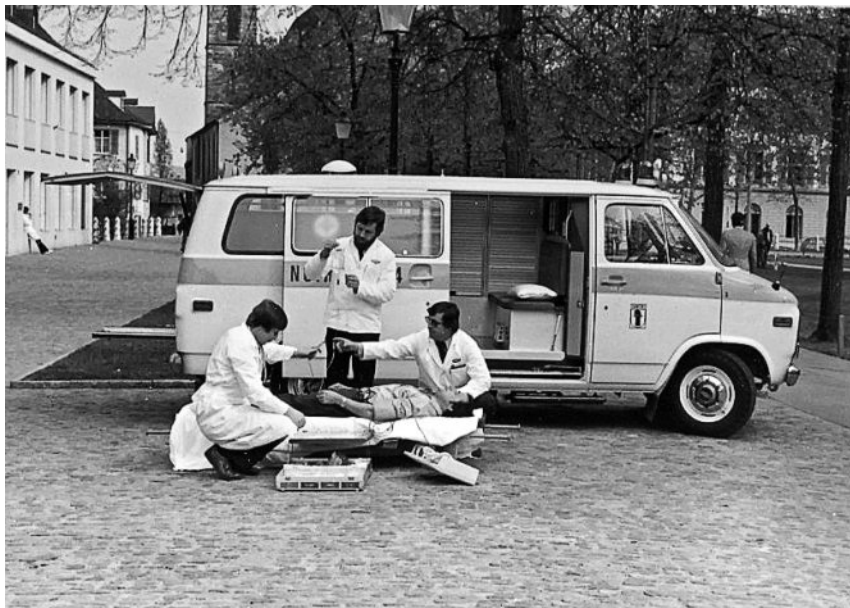
Wichtige Basler Innovation: Das 1972 geschaffene «Kardiomobil» ist eine mobile Herzstation – ein Rettungswagen mit Arzt und Defibrillator.

aus heutiger Sicht selbstverständlich erscheinen, im jeweiligen historischen Kontext «oft kritisch betrachtet wurden und sich gegen Widerstände behaupten mussten». Quer durch alle Teilbereiche der Medizin stellt die Ausstellung «Dienst am Menschen» kleinere und grössere Innovationen aus Basel vor.