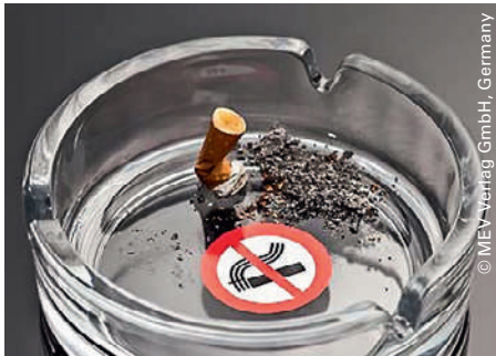
Une récompense financière peut aider à arrêter de fumer.

Des chercheurs de l'Université de Genève ont expérimenté une nouvelle manière d'inciter les fumeurs à arrêter le tabac: les récompenses financières progressives, sans aucun soutien médical ou médicamenteux. L'étude a été réalisée auprès de 800 personnes qui ont été divisés en deux groupes égaux. Le pourcentage de personnes ayant arrêté de fumer dans le groupe ne recevant aucune compensation financière s'est monté à 12% après trois mois, 11% après six mois, pour finalement chuter à 3,7% au bout de 18 mois. A contrario, les pourcentages du groupe recevant une incitation financière ont été de 55% les trois premiers mois, 45% dès six mois, pour finalement diminuer à 9,5% à 18 mois. L'on observe donc une différence de 5,8%, ce qui est un taux de réussite similaire à d'autres méthodes.