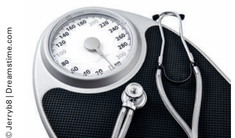
Les résultats d'un essai clinique donnent de l'espoir à des personnes souffrant d'obésité génétique: traités avec un puissant agoniste, les patients perdent du poids.

(Assistance Publique – Hôpitaux de Paris)