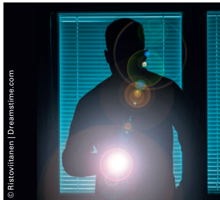
Durch die Diebstähle medizintechnischer Geräte wurde ein Schaden von schätzungsweise 11,5 Millionen Euro angerichtet. (Symbolbild)

weise Erreger, die mit dem menschlichen Erkältungsvirus, HCoV-229E, verwandt sind. Weitere molekulargenetische Vergleichsuntersuchungen zwischen Erkältungsviren in Fledermäusen, Menschen und Dromedaren legen den Schluss nahe, dass der Erkältungserreger tatsächlich von Kamelen auf den Menschen übertragen wurde: Kamel-Erkältungsviren können in menschliche Zellen eindringen – über dieselben Rezeptoren wie das Erkältungsvirus HCoV-229E. Allerdings gelingt es dem menschlichen Immunsystem, die Kamel-Viren genauso abzuwehren wie menschliche Erkältungsviren auch. Die Bonner und Berner Virologen werden in zukünftigen Studien nun die Hürden, die ein Virus beim Übertritt vom Tier auf den Menschen überwinden muss, näher untersuchen.