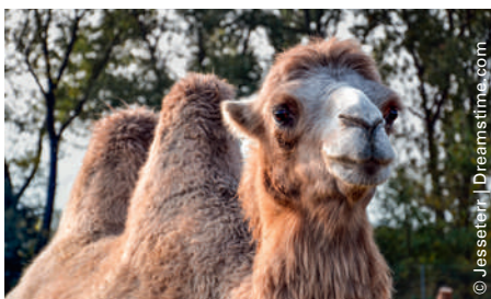
Für eines der vier menschlichen Erkältungs-Coronaviren «HCoV-229E» haben Virologen aus Bern und Bonn den Ursprung gefunden – es stammt ebenso aus Kamelen wie das gefürchtete MERS-Virus.

Virologen der Universitäten Bern und Bonn haben in Untersuchungen zu MERS rund 1000 Kamele auf Coronaviren untersucht. Bei knapp 6% entdeckten die Forschenden erstaunlicher-