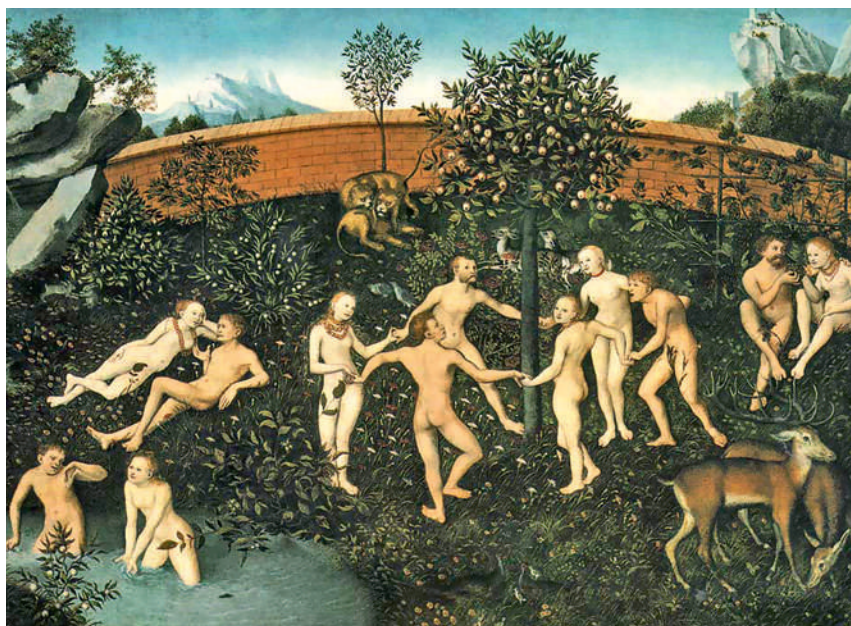
Wir entfernen uns immer mehr von der «paradiesischen Ganzheitlichkeit» – hin zur «Kopflastigkeit». (Lucas Cranach der Ältere: Das Goldene Zeitalter, um 1530.)

Berliner Max-Planck-Instituts (beteiligt sind daran aber auch die ETH Zürich und die Universität Genf sowie das CERN). Bis in zehn Jahren soll jeder Mensch/Patient ein am Computer konstruiertes Modell seines Körpers besitzen. An diesem Modell soll dann z. B. simuliert werden, wie Medikamente wirken und welche Arten von Krankheit in Zukunft mit welcher Wahrscheinlichkeit eintreffen könnten.