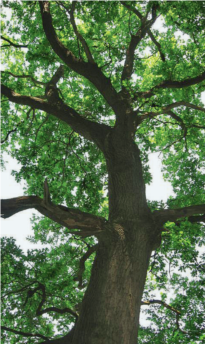
L'arbre, symbole de force vitale aussi bien que de finitude.

Cette remarque est là pour relever que ces aspects ne sont pas un propos principal du livre présenté ici, où l'immortalité est étudiée surtout dans ses aspects «classiques» du registre des sciences humaines, philosophie, théologie (l'immortalité ailleurs que dans ce monde) – avec aussi, je l'ai indiqué, des contributions biologiques. Il est bon et nécessaire que ces dimensions soient traitées de manière approfondie – et pas seulement telles «sculptures sur nuage» selon