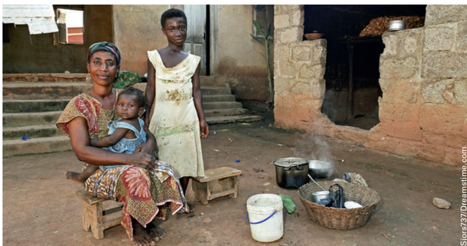
Un forum à Berne proposera un panorama des innovations sociales visant une amélioration globale de l'alimentation.

(Direction du développement et de la coopération)