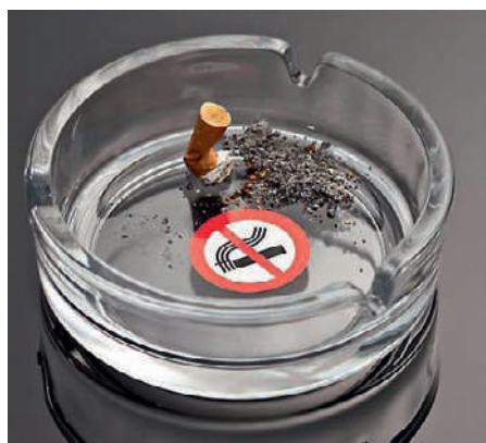
Endlich Schluss mit Zigarettenqualm in Gaststätten, das fordert die Österreichische Ärztekammer.

Deux milliards de personnes souffrent de malnutrition chronique, que l'on appelle aussi faim «invisible». Force est d'admettre que, la plupart du temps, les programmes d'aide alimentaire ne peuvent à eux seuls enrayer ce fléau, du fait, par exemple, que les maladies ou le manque d'hygiène font obstacle à l'alimentation et à l'assimilation de la nourriture par le corps. Le 18 mars prochain, un forum organisé à Berne proposera un panorama des innovations sociales visant une amélioration globale de l'alimentation, autrement dit en tenant compte des soins médicaux, des questions d'hygiène et de l'accès à l'eau potable. Une attention particulière sera accordée aux mères et aux enfants dans les 1000 jours suivant le début de la grossesse, phase critique de développement, ainsi qu'aux enfants en âge scolaire.