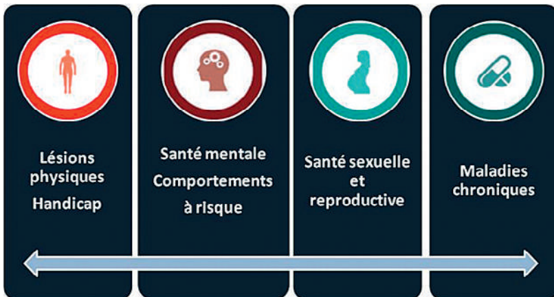
Figure 1: Impact de la violence sur la santé.

par une question que l'on imagine «déplacée», peur de ne pouvoir faire face et répondre de manière adéquate. Disposer d'une marche à suivre et d'informations pratiques nous aide à aller au-devant de nos patients de manière professionnelle.