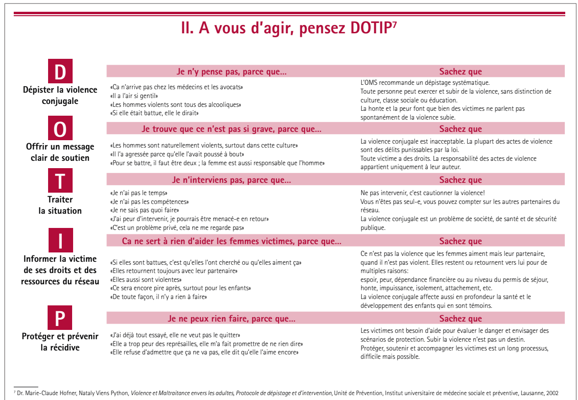
Figure 2: Le protocole (DOTIP) est disponible en ligne en français et allemand [4].

patientèle doit elle aussi être élevée. Ces patients ne doivent pas être réduits à la violence qu'ils agissent. Ils sont également en souffrance (40 à 60% des auteurs ont subi de la violence dans l'enfance) et ont besoin d'écoute et d'orientation. Des services spécialisés existent ( www.violencequefaire.ch ).