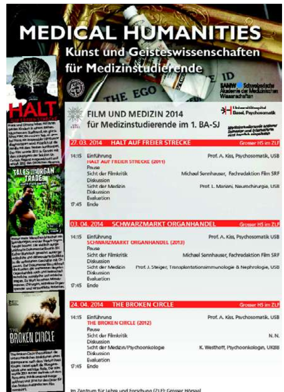
Abbildung 1: Ausschnitt aus der Programmankündigung «Film und Medizin».

An der Medizinischen Fakultät der Universität Basel wurde Medical Humanities 1998 als eigenständiges Lehrangebot eingeführt, zuerst als freiwillige, später als verpflichtende Veranstaltungen, ergänzt durch fakultative Kurse (Tab. 1). Die Zusammenarbeit von Geisteswissenschaftlern, Künstlern und Mediziner für die Planung und Durchführung war von Anfang an entscheidend. Ein Leitgedanke war, dass immer auch ein Kliniker an der Veranstaltung beteiligt ist, um so einen möglichen Transfer von Medical Humanities in den späteren klinischen Alltag aufzuzeigen.