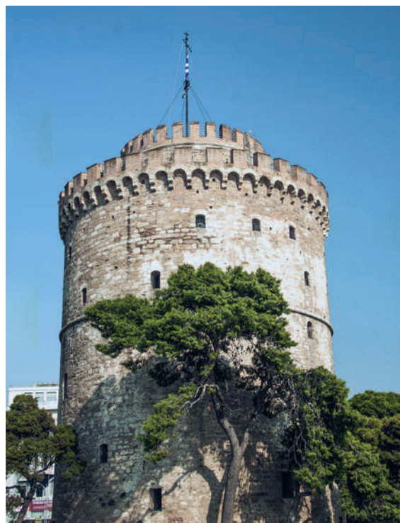
Thessaloniki, ein wichtiger Schauplatz in Hatzisaaks drittem Kriminalroman. Der weisse Turm ist ein charakteristisches Baudenkmal der griechischen Stadt.

Bei den Pavlides-Romanen handelt es sich um eine Politkrimi-Serie. In meinem Wertesystem muss Kunst, also auch Literatur, aufklärerisch und politisch sein. Wir alle sind politische Menschen. Menschen, die in einem sozialen Gefüge, einer «Polis» verankert sind. Es ist unsere existenzielle Pflicht, uns kritisch damit auseinander zu setzen. In meinem Fall geschieht dies als Recherche und Reflexion über politische Ereignisse und Tatsachen der jüngsten Vergangenheit, z.B. über CIA-Geheimgefängnisse, die ich als Kontext für die fiktiven Handlungen meines aktuellen Politkrimis verwende.