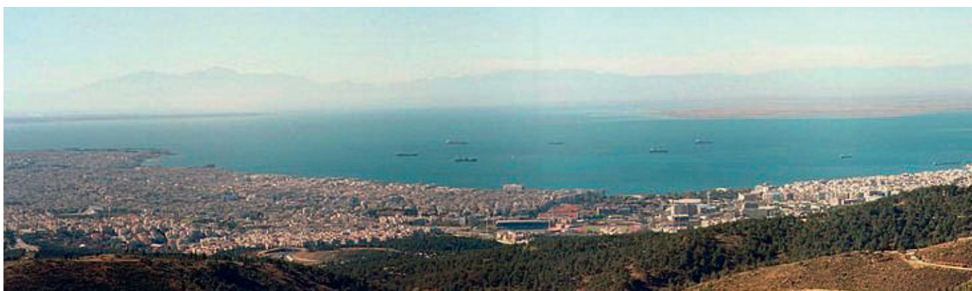
Das Panorama von Thessaloniki mit dem Olympos-Massiv im Hintergrund.