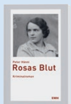
Rosas Blut von Peter Hänni