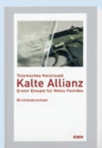
Kalte Allianz von Telemachos Hatziisaak