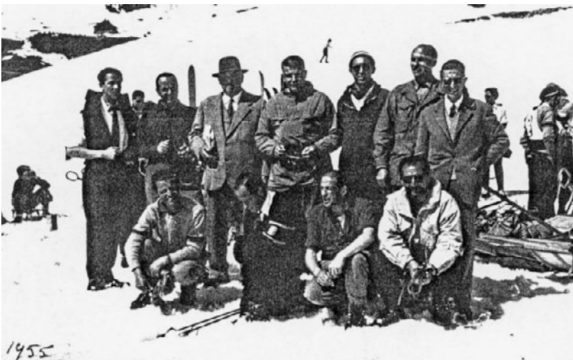
Abbildung 1: Die nationalen Sekretäre der 1956 gegründeten SITEMSH an einem Treffen 1955.