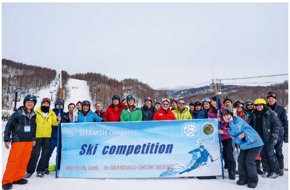
Abbildung 2: Die «Coupe du président» 2016 in Inawashiro, Japan.

Und die SITEMSH wurde immer internationaler, aber auch immer kleiner. Neben den erwähnten Gründerländern stiessen Andorra (1990), Spanien (1993), Chile (2007), Griechenland (2008), Argentinien, die USA, Schottland, Tschechien und Ungarn dazu. Ganz neu sind nationale Sekretäre aus Japan, Iran, Kasachstan und China. Heute zählt die SITEMSH 18 Mitgliederlän-