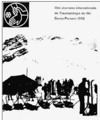
Abbildung 3: Das Ankündigungssplakat des Kongresses 1958 in Davos.