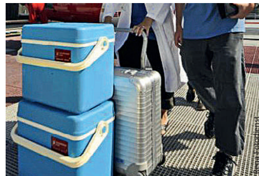
In Deutschland warten noch über 12000 Menschen auf ein lebensrettendes Organ.