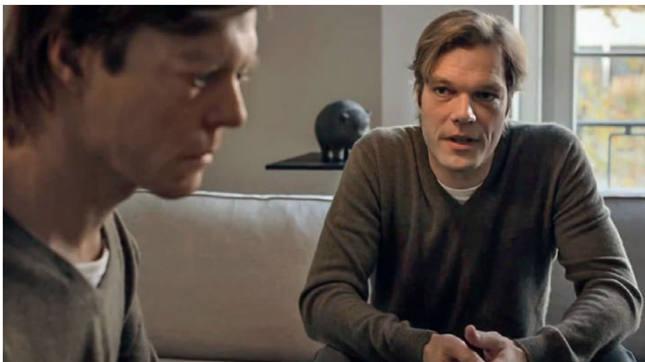
Une dépression ou une autre maladie psychique peuvent être tout handicapantes.