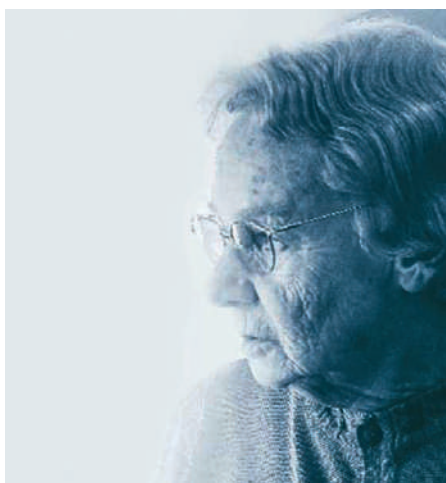
Einfache Notizen lesen, telefonieren, Vorlesegeräte nutzen: Das ist hochaltrigen Menschen mit Sehbehinderung wichtig.

Sehbehinderung im Alter ist auf dem Vormarsch. Die Forschung des Schweizerischen Zentralvereins für das Blindenwesen SZB fasst die Ergebnisse ihrer aktuellen Studie im neu erschienenen Themenheft «Sehbehinderung im Alter – komplex und vielfältig» zusammen (Download www.szb.ch → Forschung) und zeigt, wie Menschen im Alter mit einer Sehbehinderung umgehen und welche Faktoren eine Rolle spielen, um Lebensqualität zu erhalten. Hochaltrigen Menschen mit Sehbehinderung liegt beispielsweise viel daran, wenigstens einfache Notizen zu lesen, das Telefon zu benutzen oder Vorlesegeräte anwenden zu können. Als wichtigstes Fazit halten die Autoren fest: «Die Menschen entscheiden selbst, was sie weiterhin selbständig tun und für was sie Hilfe organisieren möchten», so Stefan Spring, Forschungsbeauftragter beim SZB. (SZB)