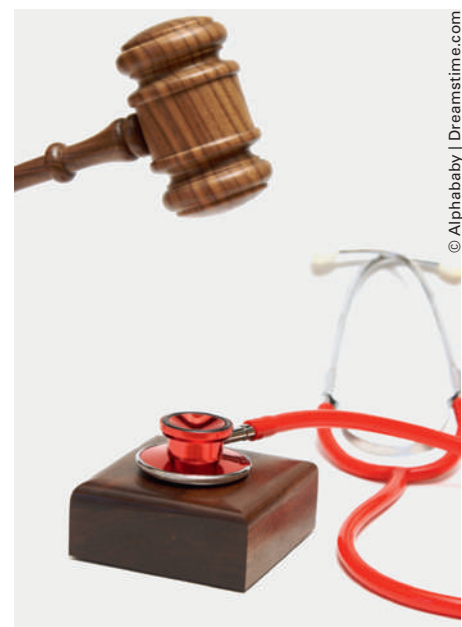
Bald einfacher und differenzierter anzuwenden: das Unfallversicherungsrecht.