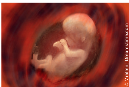
Die mütterliche Darmflora stärkt das Immunsystem des Babys bereits im Uterus.