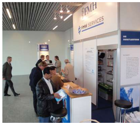
Au Salon spécialisé du marché de la santé (IFAS), le stand de la FMH et de FMH Services attire les visiteurs.

Vous trouverez le formulaire d'inscription et de plus amples informations sur les ateliers sur le site de la FMH: fmh.ch → Services → encadré gris en haut de la page. Veuillez noter que les ateliers auront lieu uniquement en allemand.