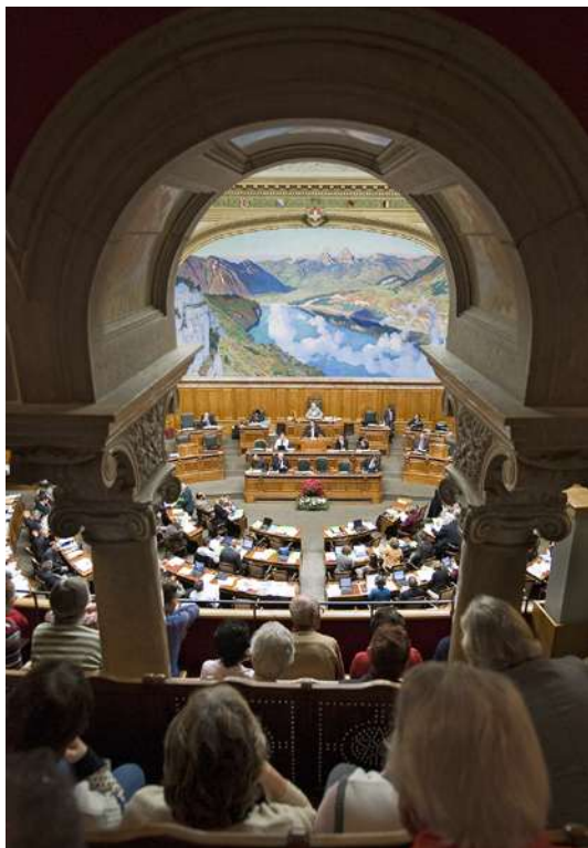
Avant chaque session, la FMH propose des recommandations aux parlementaires.