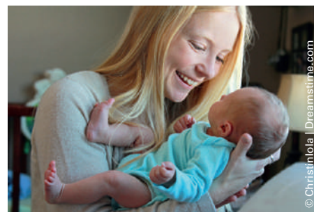
La campagne Ruban Blanc s'engage pour les droits de la femme et des enfants.