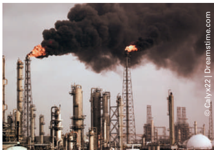
95 Millionen Menschen sind durch die sechs weltweit gefährlichsten Umweltgifte bedroht.

Der neue, von der Umweltorganisation Green Cross Schweiz und der in New York ansässigen Pure Earth publizierte Umweltgiftreport 2015 identifiziert die sechs weltweit gefährlichsten