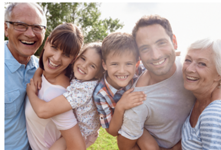
Kontinuierlich steigendes Selbstwertgefühl.