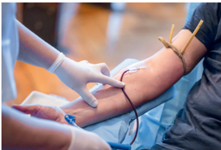
Blutspenden werden künftig auch auf Hepatitis-E-Viren untersucht.