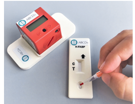
Une goutte de sang suffit à TBIcheck pour diagnostiquer un éventuel trauma cérébral léger. Si une ligne apparaît sous la ligne de contrôle, le blessé devra se rendre à l'hôpital passer un CT-scan.