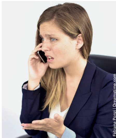
Si arrêter à fumer est trop dur: la ligne stop-tabac 0848 000 181 peut aider.