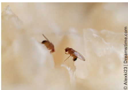
Drosophila melanogaster soll zeigen, wie aggressive Zellen in gesundes Gewebe eindringen.

Forscher haben entdeckt, wie aggressive Zellen im frühesten Stadium der Tumorentwicklung in gesundes Gewebe eindringen können.